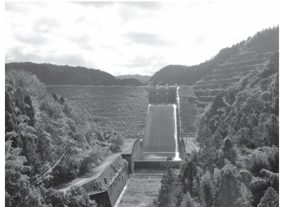
写真-1 合所ダムの堤体状況

合所ダムは既成田の用水不足の解消、既成畑および新規造成耕地への水源確保を主目的として農林水産省九州農政局の耳納山麓土地改良事業によって筑後川水系隈上川 くまのうえ に築造されたものである(写真-1)。