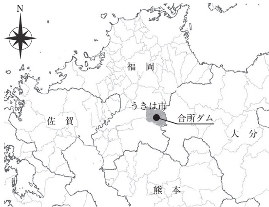
図-1 合所ダムの位置図