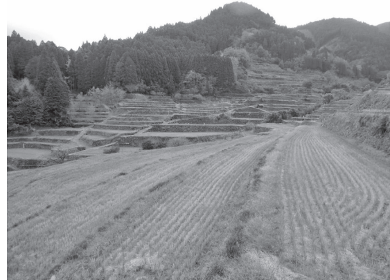
写真-2 つづら棚田の状況