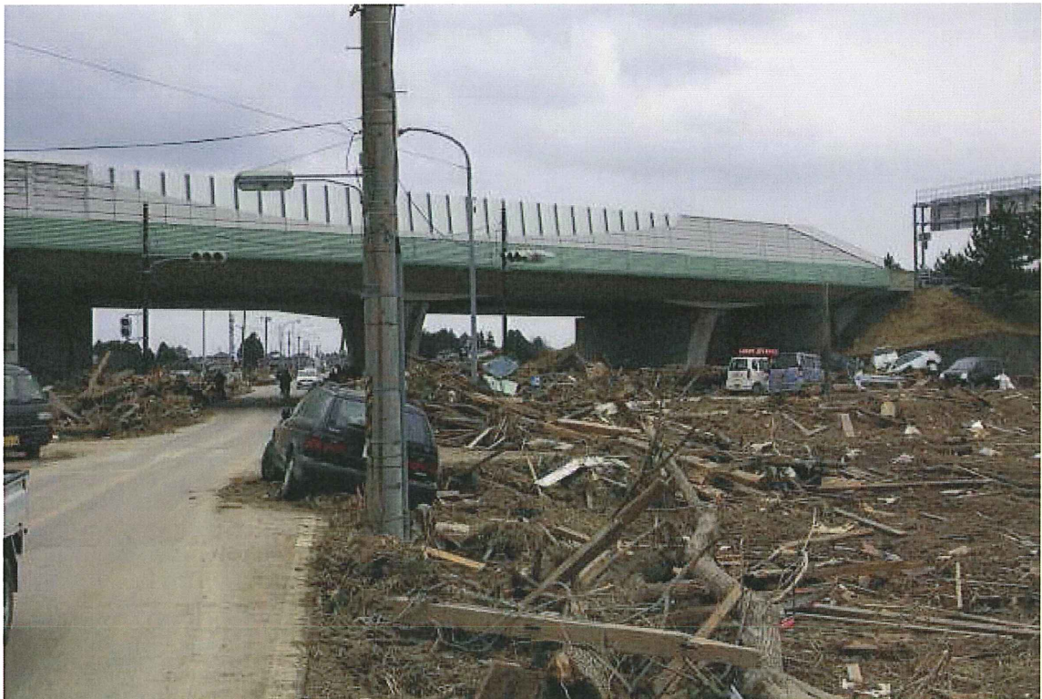
⑧道路(仙台市若林区二木前) 仙台東部道路と県道 54 号線の交差部。東部道路東側から津波で流された車、家屋などの残骸が極端に多くなる。