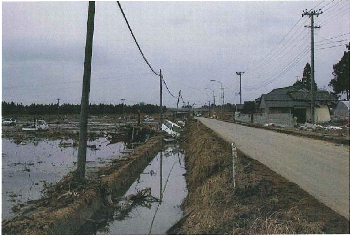
①水路(仙台市若林区笠神) 車が水路に落ちている。水田, 水路とも水は残ったまま。