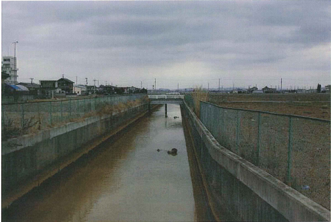
①排水路(仙台市若林区今泉) 崩壊した箇所は見られない