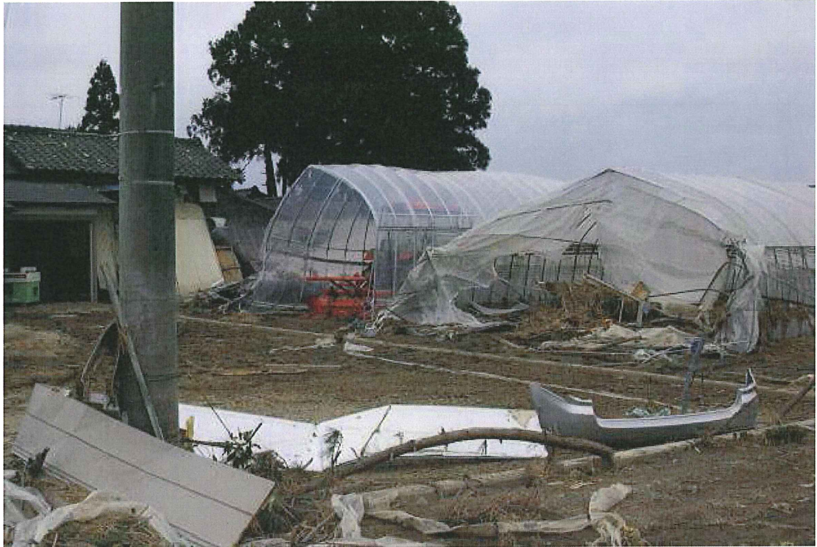
⑬農家(仙台市若林区種次) ビニルハウスが壊れている。1階部は浸水。トラクターが無事かは不明。