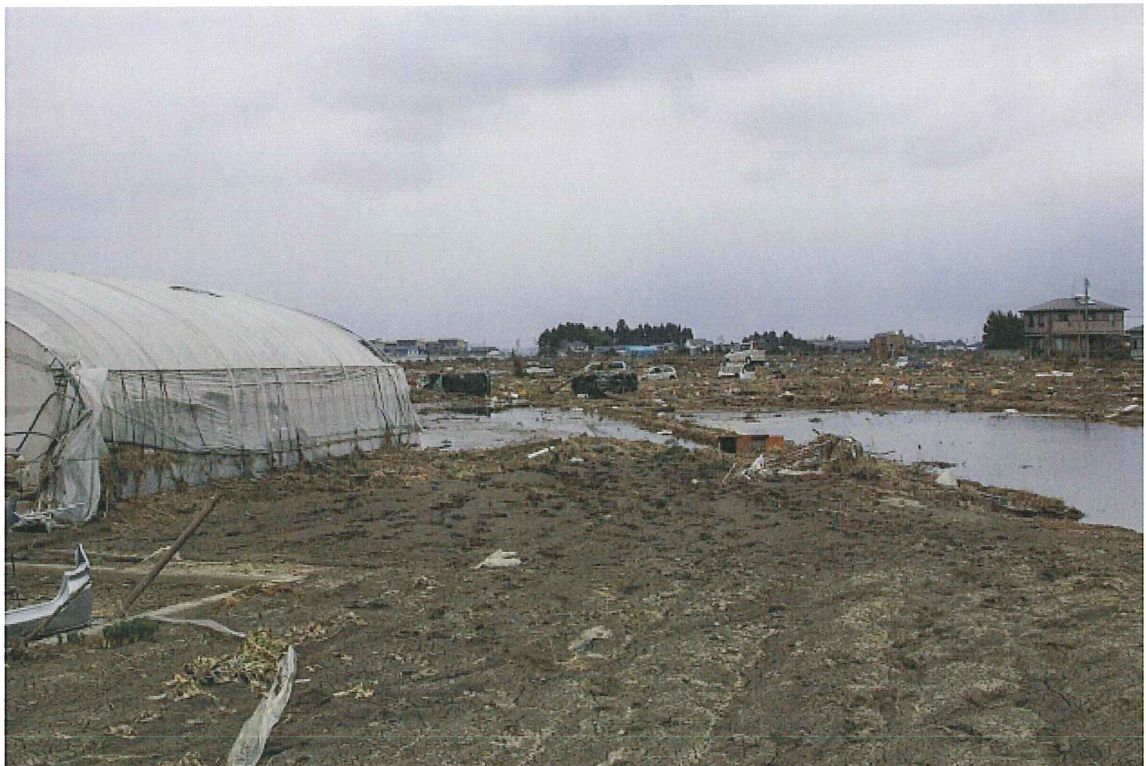
⑭水田(写真⑬の奥)(仙台市若林区種次) 車の残がいが見られる。