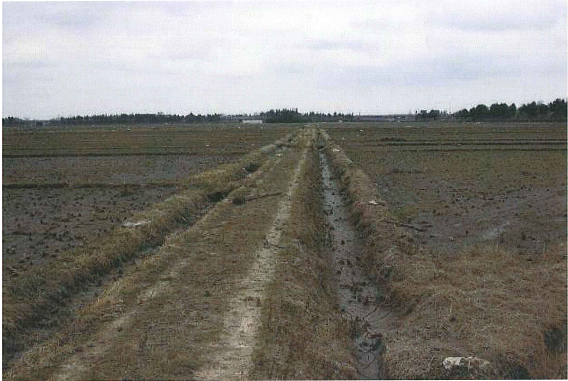
⑤耕作道(仙台市若林区今泉) 耕作道, 畦畔とも地震・津波による大きな被害は見られない。