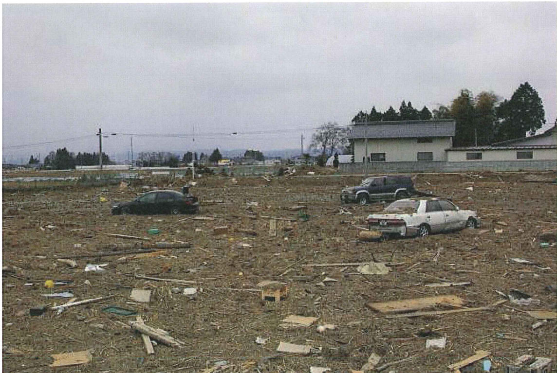
⑩水田(仙台市若林区二木前(仙台東部道路東側)) 車, 家屋などの残がいで水田が覆われている。