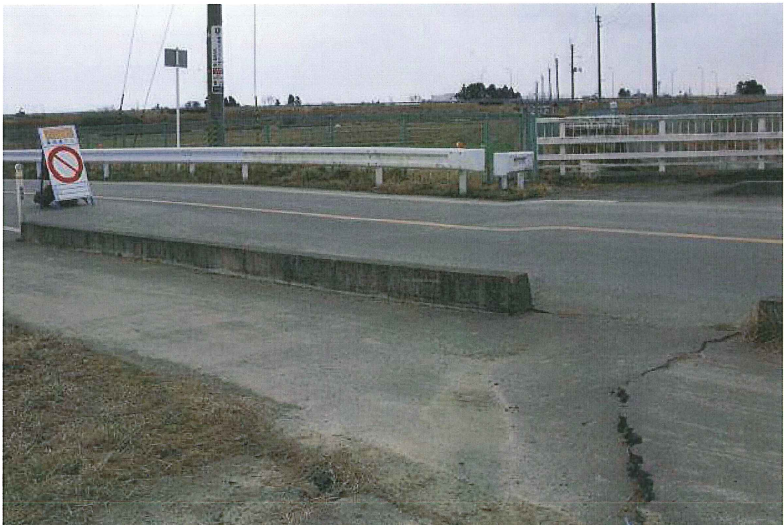
②排水路と県道 54 号線の交差点(仙台市若林区今泉) 沈下により歩道に亀裂