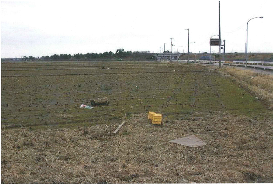
③水田(仙台市若林区今泉) 津波による流木等が見られる。水は引いている。