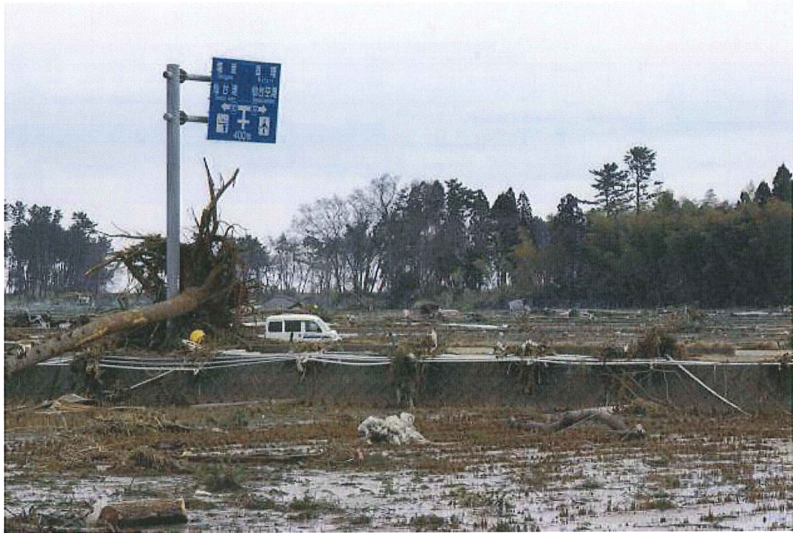
⑩水田(仙台市若林区二木) 水が残っている。