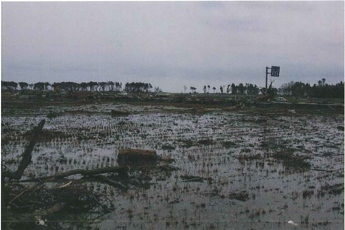
⑩水田(仙台市若林区二木) 水が残っている。