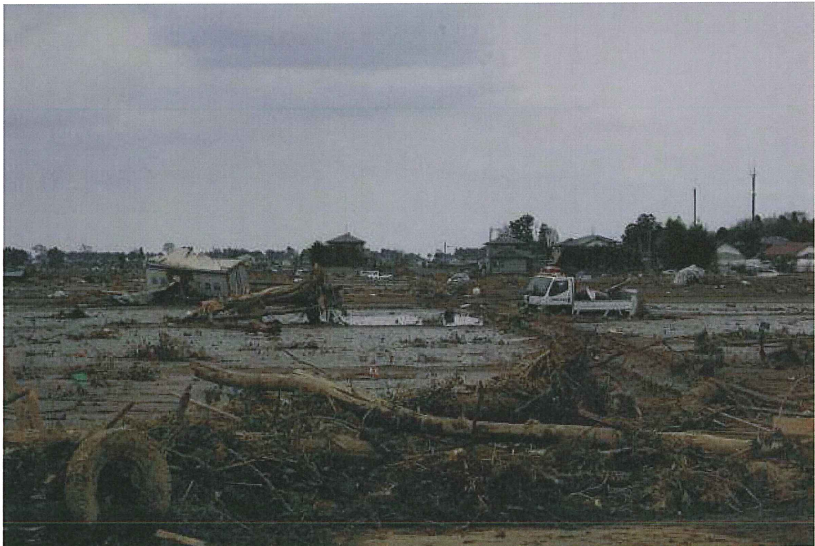
②水田(仙台市若林区笠神) 車, 流木等が多い。水田には水が残っている。