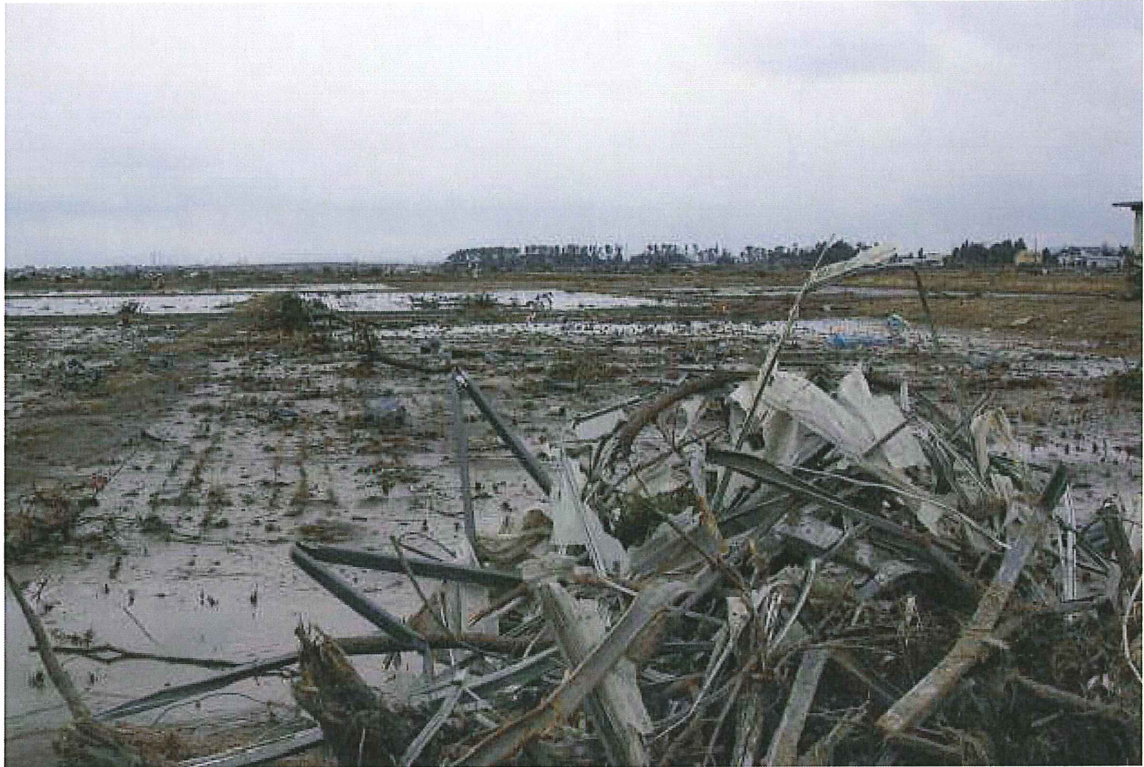
⑩水田(仙台市若林区山王) 水が残っている。手前のガレキは道路から寄せたもの。