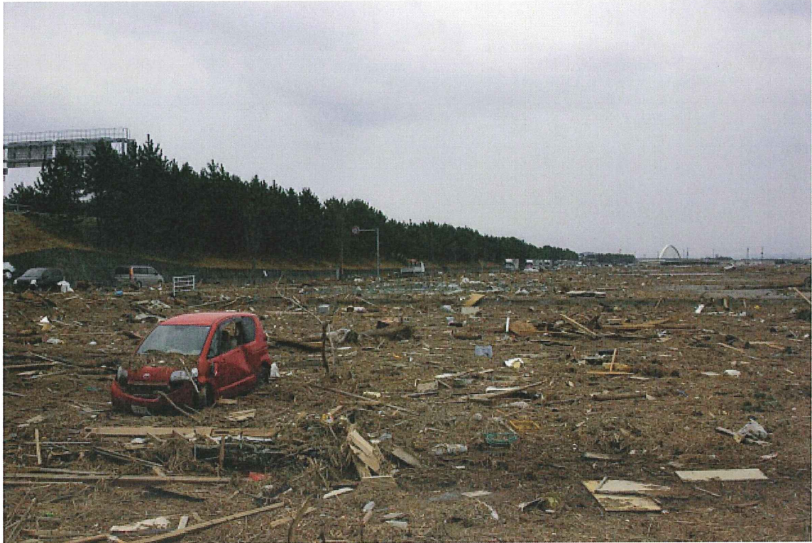
⑨水田(仙台市若林区二木前(仙台東部道路東側)) 車, 家屋などの残がいで水田が覆われている。