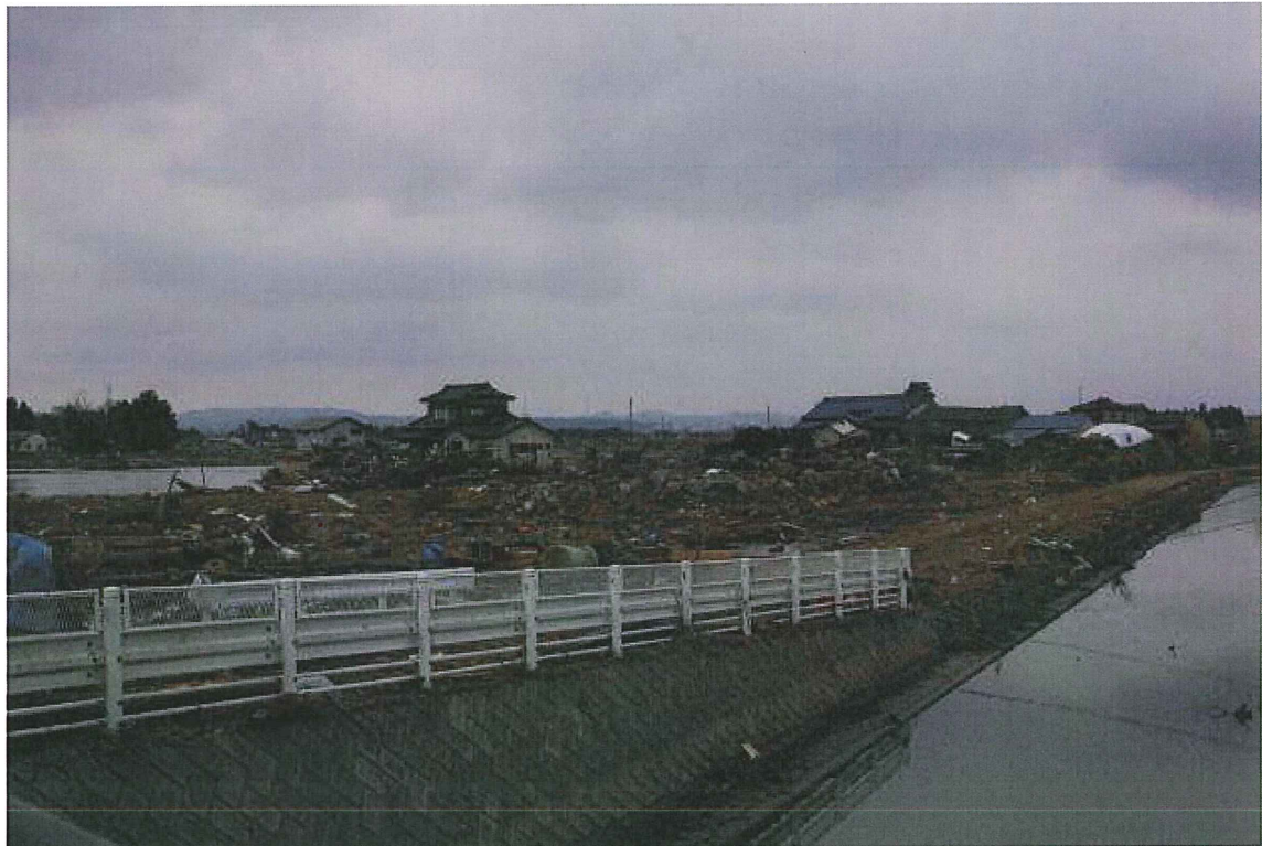
⑪井土浦川とその周辺