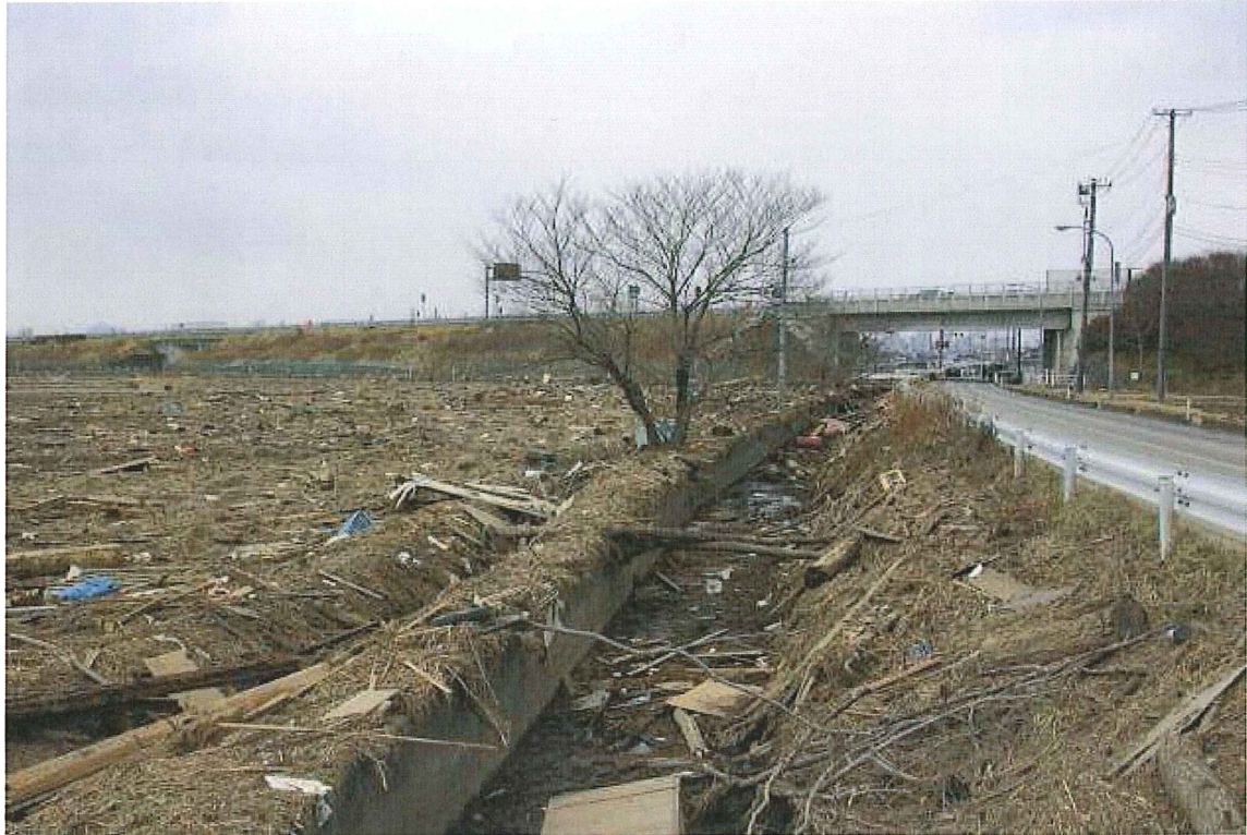
⑦排水路(仙台市若林区二木前) 津波による多くの流木等が見られる。水は引いている。奥に見えるのは仙台南部道路。