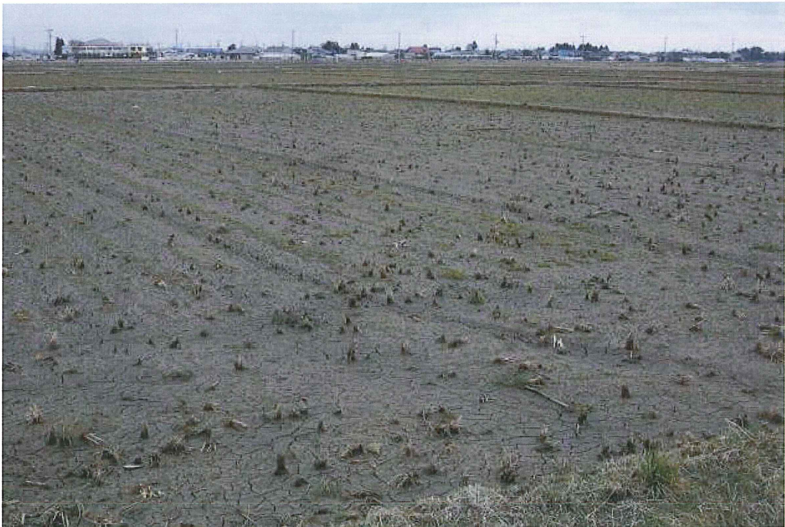
④水田(仙台市若林区今泉) 津波により湛水後し, 最近水が引いたと思われる。