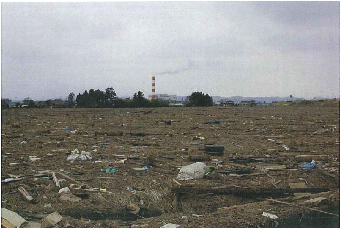
⑥水田(仙台市若林区二木前) 津波による多くの流木等が見られる。水は引いている。