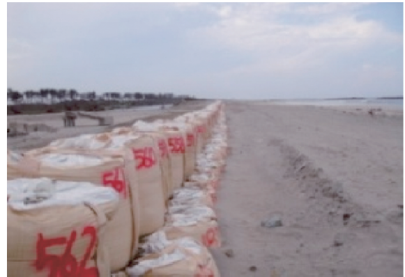
亘理・山元農地海岸 破堤部の応急復旧