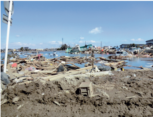
津波被害を受けた農地 ガレキの堆積状況