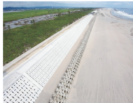
亘理・山元農地海岸 海岸堤防の復旧