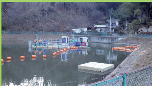
ため池の放射性物質対策 (例) ~ポンプ浚渫工法~