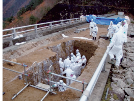
請戸川地区大柿ダム 被災状況調査