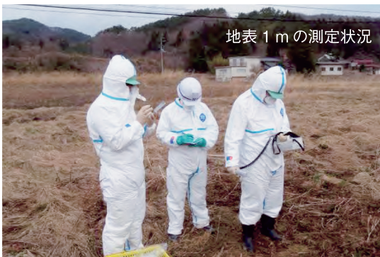
農地での空間線量の測定