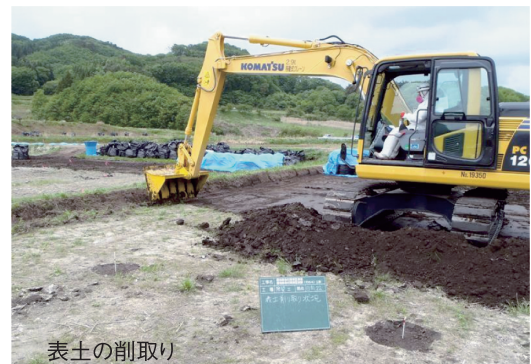
農地除染の実証工事