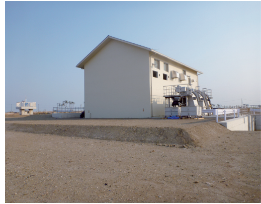
仙台東地区 大堀排水機場の復旧