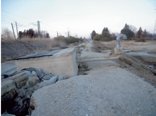
隈戸川地区 パイプラインの浮上