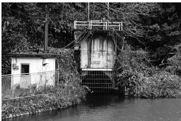
写真-3 放水路トンネル（余呉川合流地点）

台風 21 号の影響により倒れてしまった。なお、このヤナギは、湖の北西にある、伝説ゆかりの北野神社から移植された 2 代目であった。