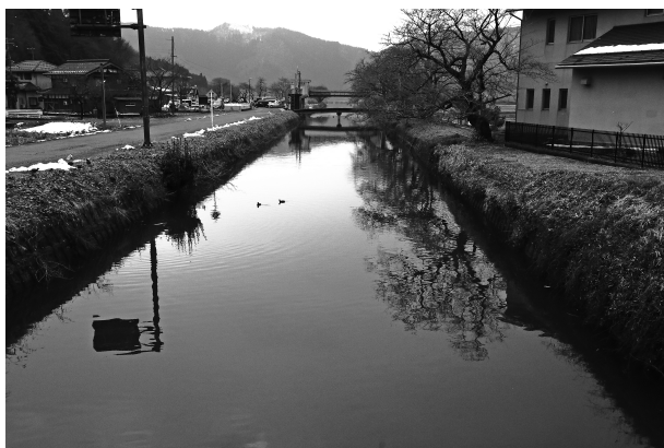
写真-2 余呉川導水路（余呉湖流入地点付近）