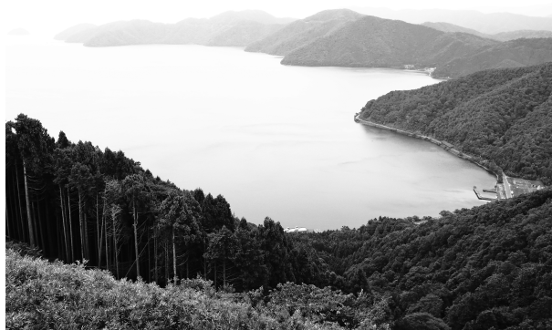
写真-1 賤ヶ岳から琵琶湖を望む

余呉湖は日本最古の天女伝説の地ともいわれており、JR余呉駅に近い湖北岸には、天女の羽衣伝説にちなんで「天女の衣掛柳」とよばれるヤナギの木（マルバヤナギ）があった。しかし2017（平成29）年の