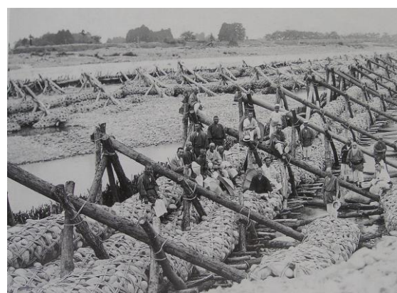
写真1 舟戸口用水取水施設（昭和11年）