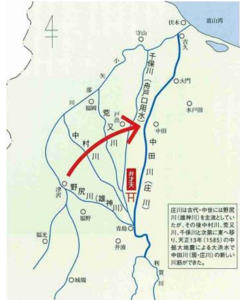
図1 庄川の河道変遷

このように開田が進むにつれて整備された用水路（庄川両岸に12施設：図2）であるが、これらの整備・管理費は、工事規模に応じて御納戸銀（藩費）、諸郡打銀、郡打銀、江下米（維持管理費）に区分された。また、管理組織は改作奉行のもと郡奉行-十村-江（用水）肝煎-江下総代に組織化され、明治以降は水利組合に再編されている。取入れ口は各用水が各々で設けて、庄川に川倉（図3、写真1）を設置して導水した。しかし、出水の度に修復をする必要があること、干ばつ時には上下流で河川水が取り合い