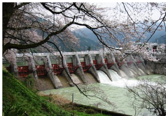
写真2 庄川用水合口ダム