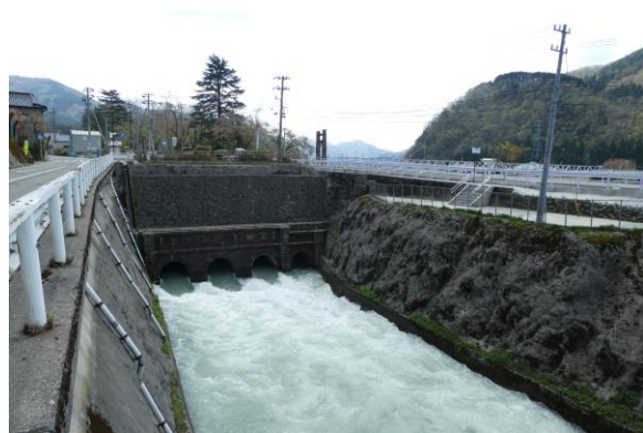
写真 4 現在の給水口

Current starting point of main irrigation canal