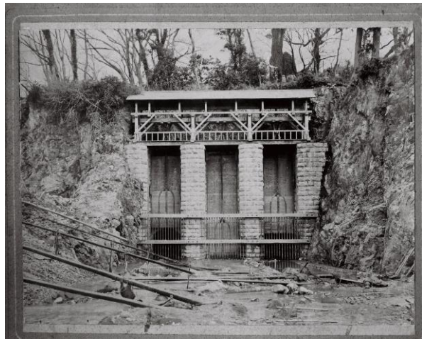
写真1 竣工時の七ヶ用水大水門