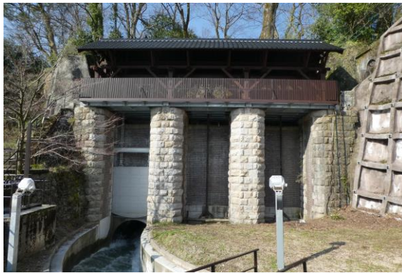
写真 3 現在の大水門

5. おわりに 都市住民はもとより、近年では農村住民においても七ヶ用水を知らない人が増加しており、かんがい、治水のみならず、消流雪、防火、親水等、地域に欠かせない七ヶ用水を次世代に適切に引き継いでいくため、地域住民への広報活動に努めたい。