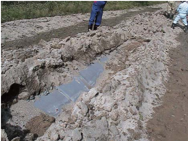
9. 管水路（厚真町） 埋設管が地上付近まで浮上した厚幌導水路