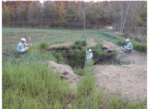
10. 管水路（安平町） 水土里（みどり）災害派遣隊による被災調査