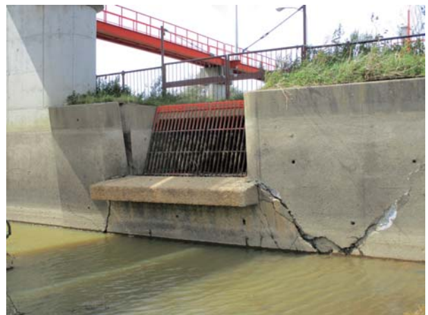
6. 9区頭首工（厚真町） 取水口付近のコンクリート擁壁の傾倒やクラックの発生