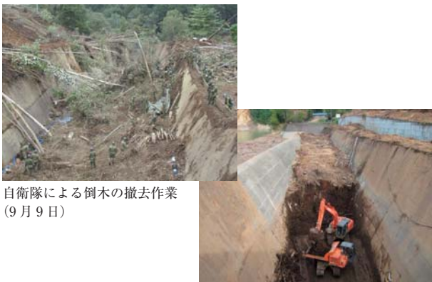
自衛隊による倒木の撤去作業 (9月9日)