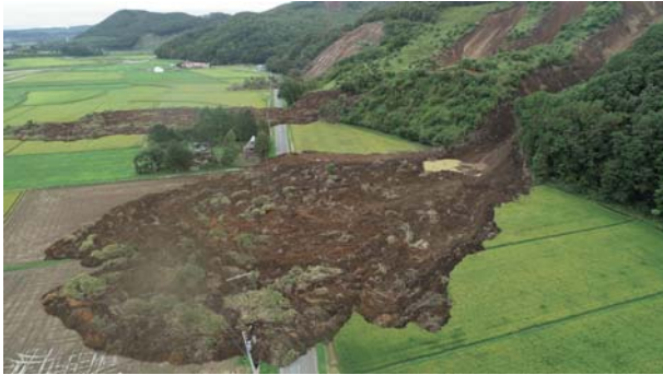
1. 被災農地（厚真町） 斜面崩壊による土砂が堆積した農地