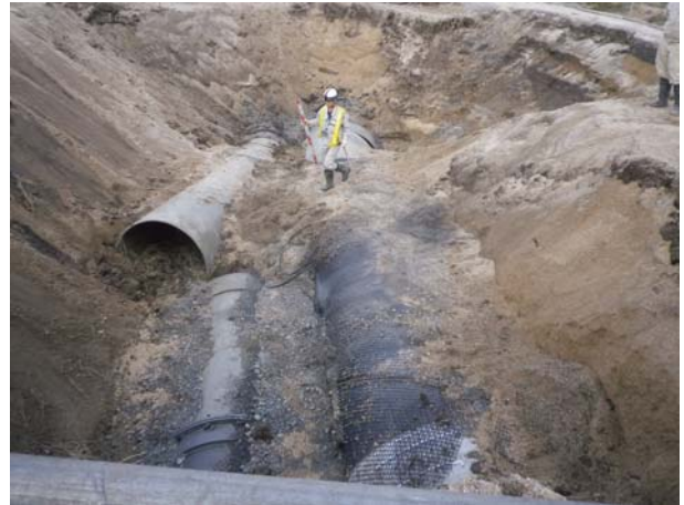
8. 管水路（厚真町） 屈曲部付近で破損した厚幌導水路の並列埋設管