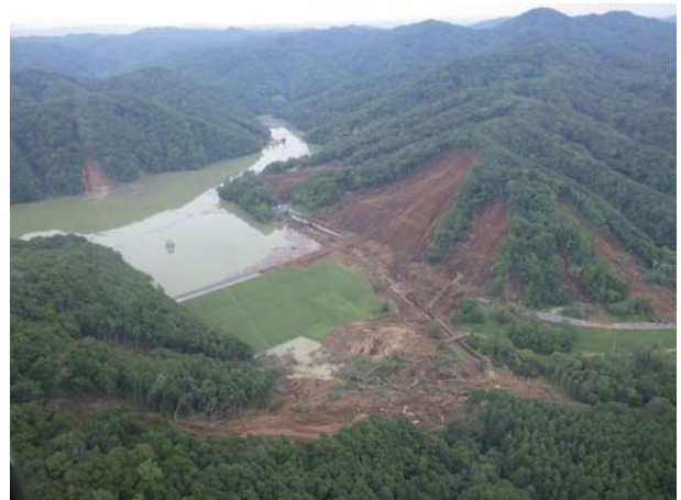
4. 厚真ダム（厚真町） ダム堤体周辺の斜面崩壊と土砂の堆積状況