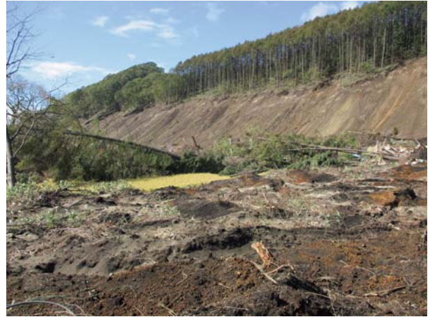
2. 被災農地（厚真町） 堆積土砂に埋もれた水田