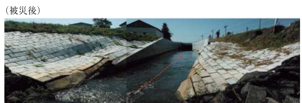
12. 排水路（むかわ町） 連節ブロックの沈下や法面が変形した田浦第1幹線排水路