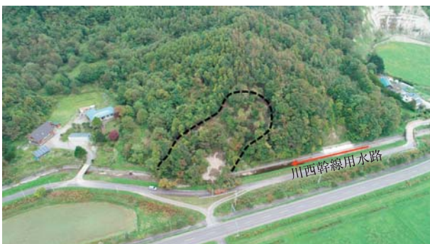
11. 開水路（むかわ町） 斜面崩壊で堆積した土砂により閉塞した川西幹線用水路