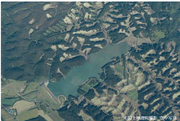
3. 瑞穂ダム（安平町） ダムおよび貯水池周辺に発生した無数の斜面崩壊