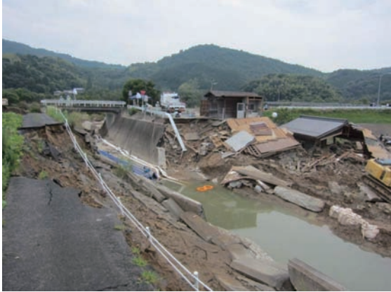
7. 岡山県高馬川の破堤