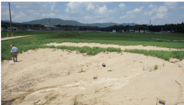
9. 広島県三原市・東広島市の流入土砂