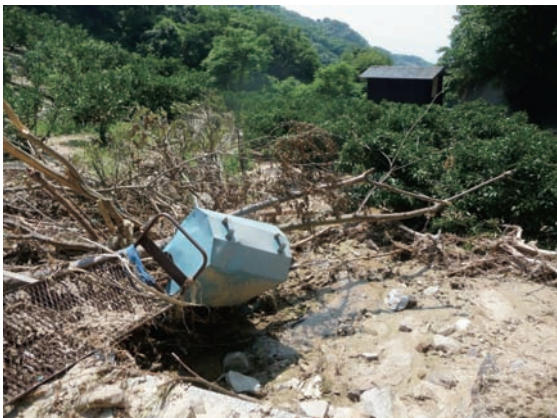
11. 愛媛県松山市神浦の農地 (樹園地) の被害