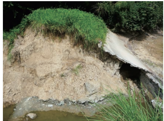
10. 愛媛県宇和島市吉田町の鳥首池堤体決壊