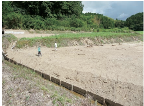
12. 愛媛県宇和島市三間町の農地 (水田, 畑地) の被害