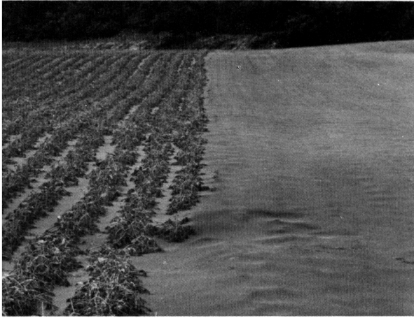
降灰約20cm (左) 菜豆、(右) ニンジン