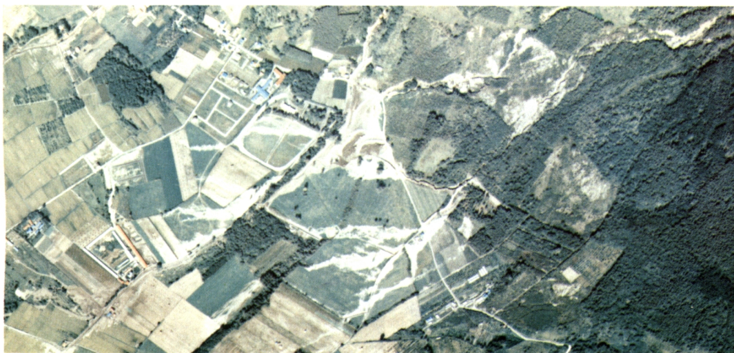
山地より農地への降灰物の流出状況（北海航測）