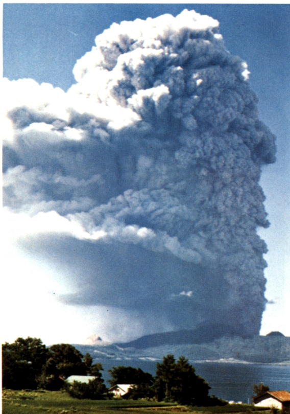
有珠山噴火の様相、1977年8月7日 9時12分噴火開始、 9時45分ごろ洞爺村より