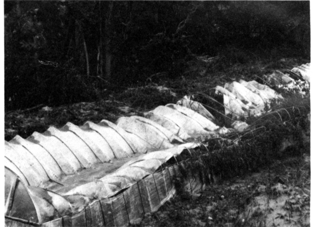
倒壊したビニールハウス