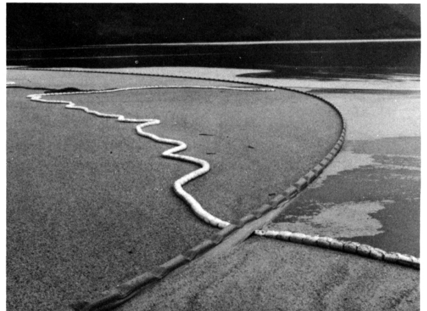
洞爺湖の湖面に浮んだ火山レキは約3週間で除去された