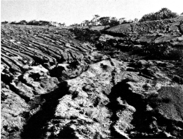
降雨によりガリが発生している