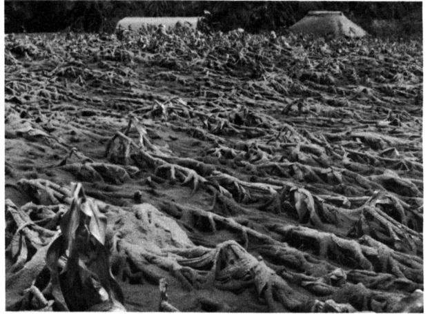
トウモロコシ畑 降灰約5 cm