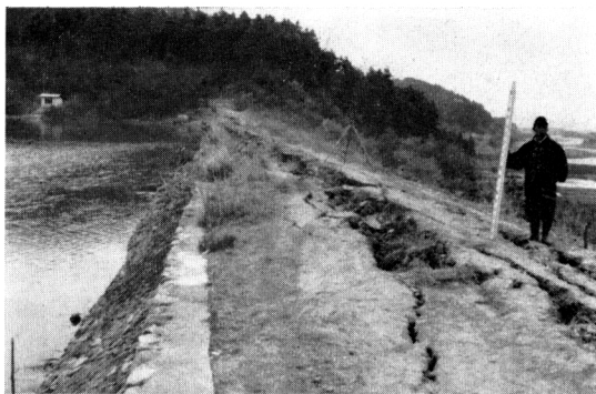
写真-2 田の沢ダムの堤体の滑動と沈下、左岸上流側より見る