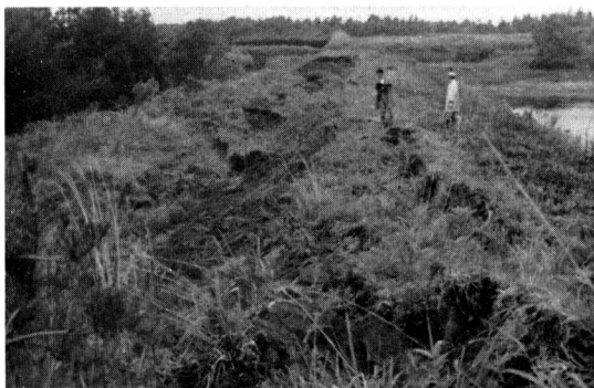
写真-4 笠井ダムの液状化による下流側滑動