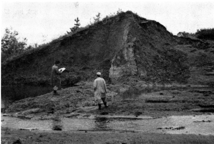
写真-1 一里小屋ダムの中心壁と決壊の状況