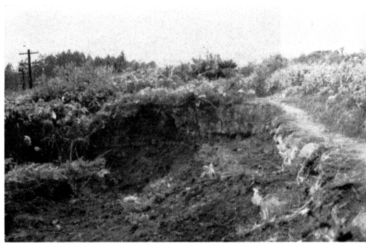
写真-3 近川ダムの下流側滑動