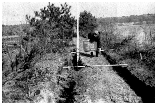
写真-5 中村ダム堤頂キ裂、右側が上流