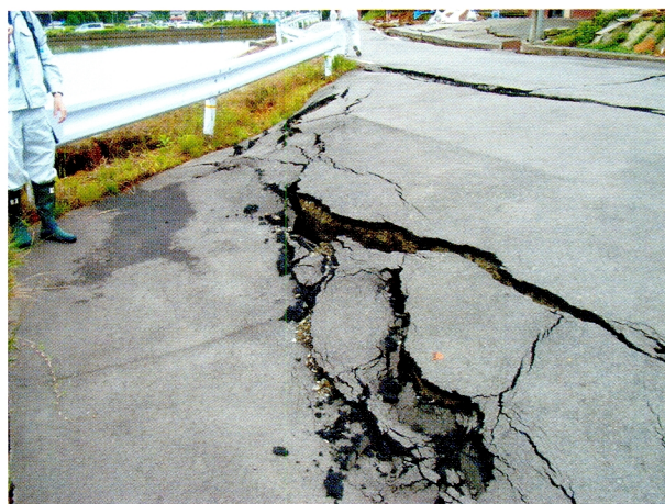
(2) ため池周辺道路の陥没 (柏崎市西山町の東大池)