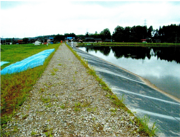
(7)ため池堤体に生じた軽度の表層すべり (刈羽村井岡の大池)