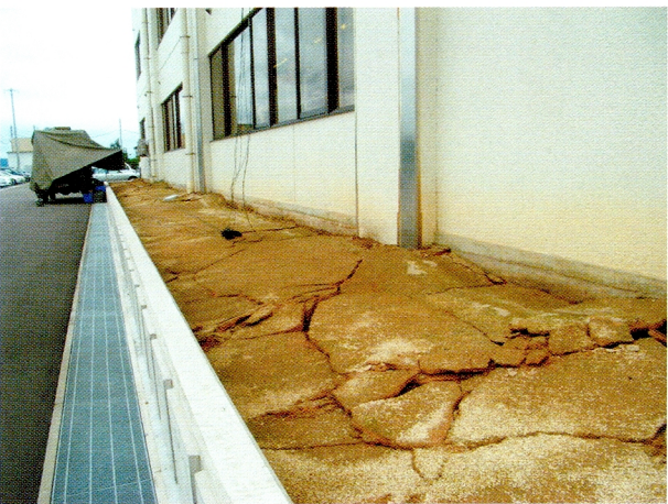
(9)災害対策本部となった刈羽村役場の建物周辺に生じた地盤沈下 (刈羽村)