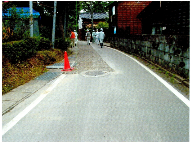
(8)マンホールの浮き上がりと道路陥没を仮復旧した集落排水管路、手前のアスファルト部は2004年新潟県中越地震で被災し改良土で埋め戻された箇所 (刈羽村東城地区)