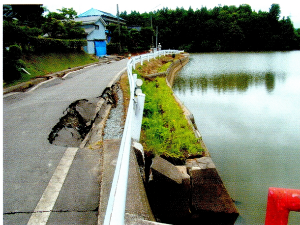
(1) ため池護岸の半倒壊 (柏崎市西山町の東大池)