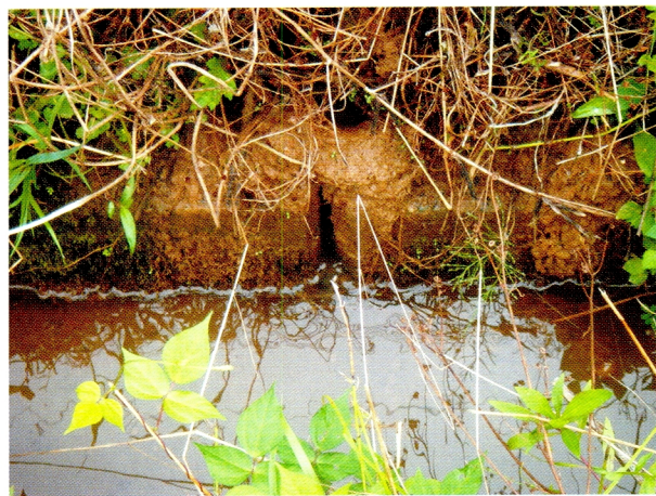
(4) ため池堤体亀裂に伴う漏水 (柏崎市西山町の東大池)