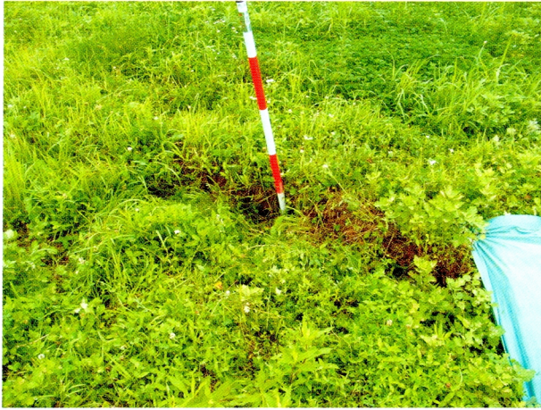
(5)ため池堤体に発生した亀裂 (刈羽村井岡の大池)