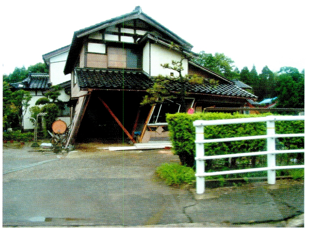
(10)無惨に倒壊した農家家屋 (刈羽村)