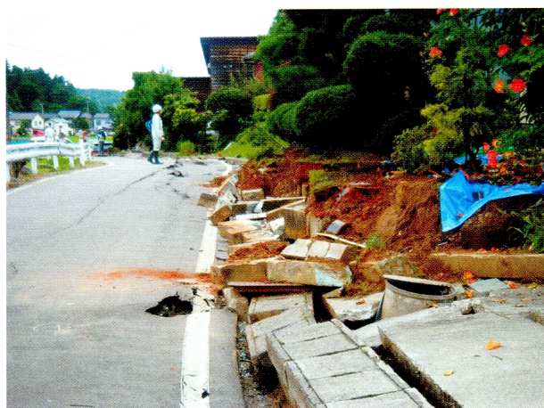
(3) 半倒壊したため池護岸に隣接する民家壁の倒壊 (柏崎市西山町の東大池)