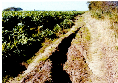
4. 河川沿いにあるビート畑の地すべり (浦幌町)