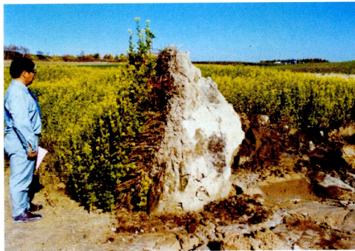
5. 噴砂の吐出により直立した畑地表面 (端野町)