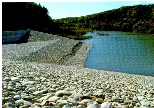
7. 幕別ダム周辺の地山保護盛土のずれ (幕別町)