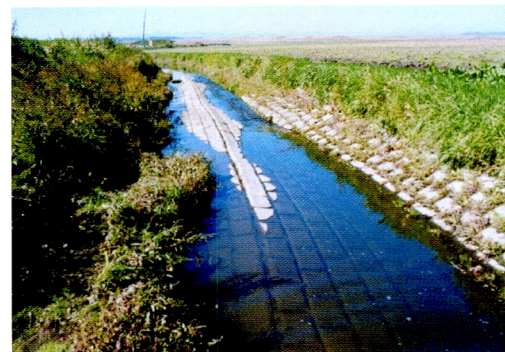
8. 排水路法面の押し出しによる連結ブロックの褶曲 (池田町)