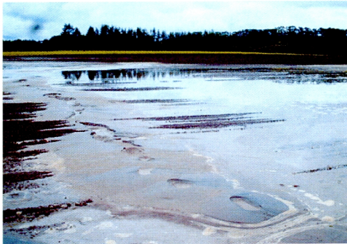
1. 農地に湛水した噴出水 (豊頃町)