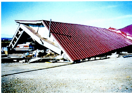
3. 地震による農家納屋の倒壊 (豊頃町)