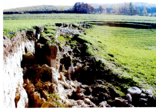
6. 左写真の噴砂により大陥没を起こした小麦畑 (端野町)