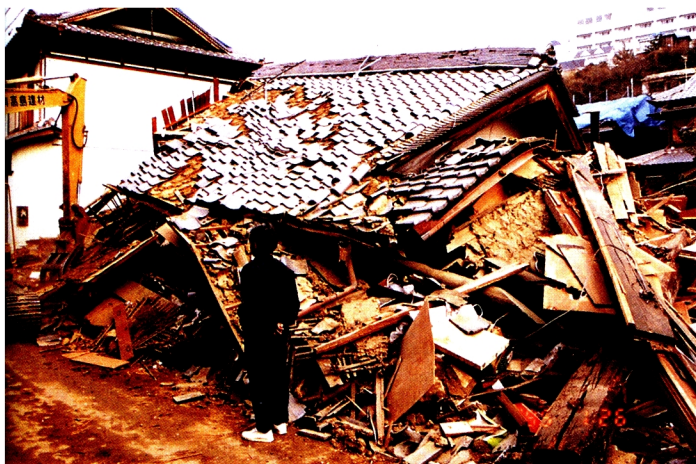
7. 屋根に押し潰された格好の家屋 (北淡町富島)