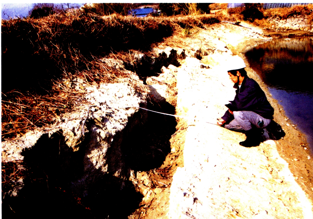
9. 荒神池の前法 縦断亀裂(7~9, 本文pp.23~28 参照)