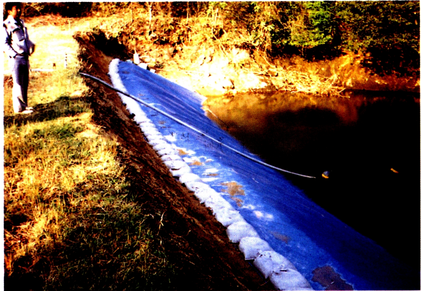
5. シートによる被覆 (東浦町上下谷下池)