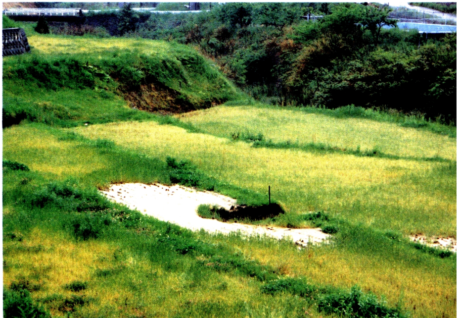
14. 湧水跡(淡路町谷山地区) (本文pp.45~50参照)