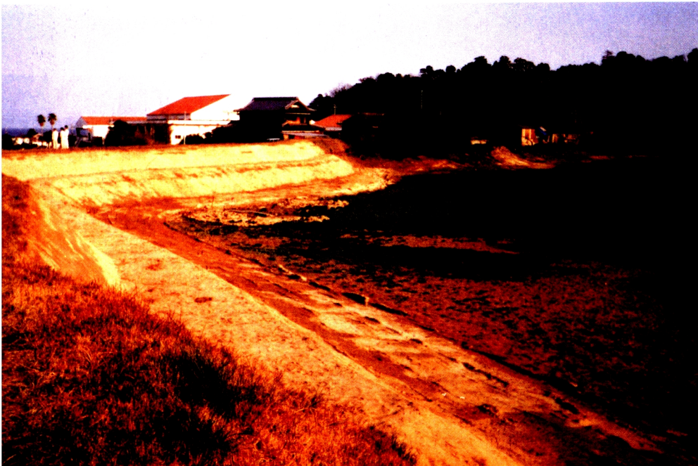
6. 前法盛土 (4~6, 本文pp.19~ 21参照)