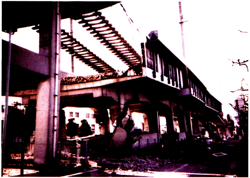
1. 山陽新幹線・阪水高架橋(西宮市)