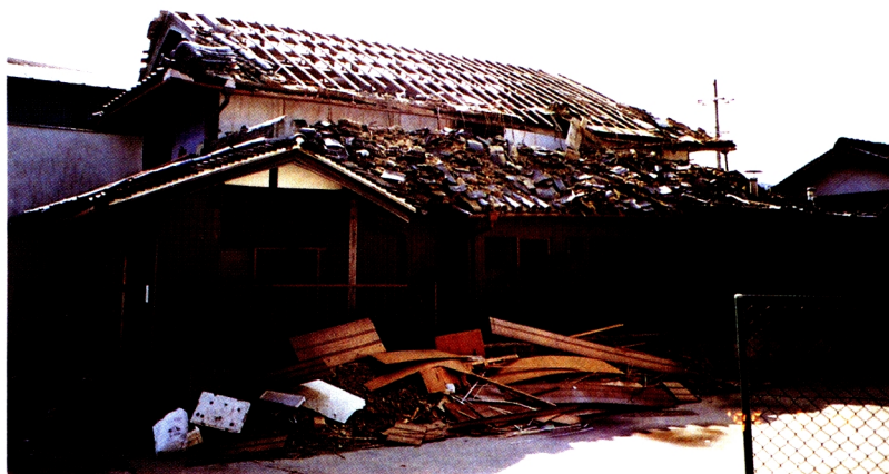
8. 瓦は落ちたが潰されずに 残った家屋(一宮町郡家)