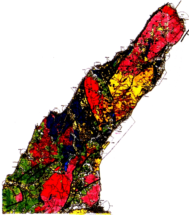
10. 淡路島の被害溜池分布、表層地質および活断層（地質図は地質調査所版に基づく）