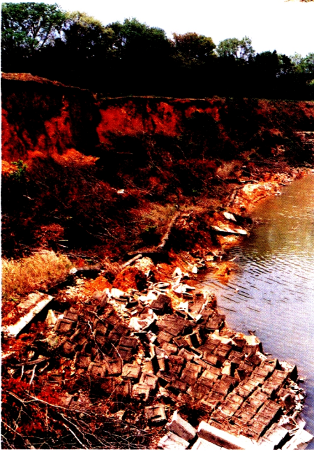
13. 大堤防池の崩壊(神戸市西区) (10~13, 本文pp.39~44参照)