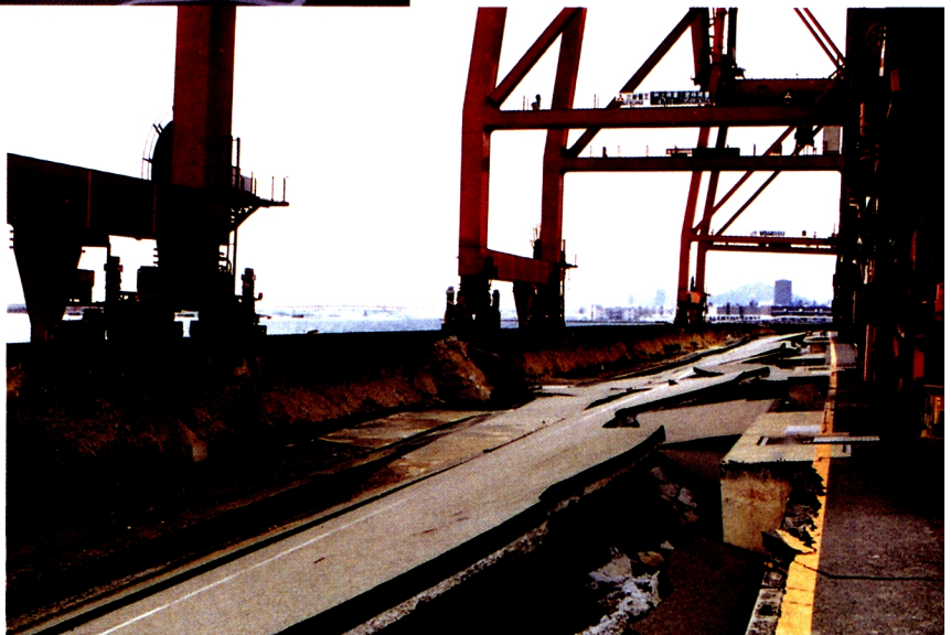
3. 神戸港摩耶埠頭 (1~3, 本文pp.9~14参照)