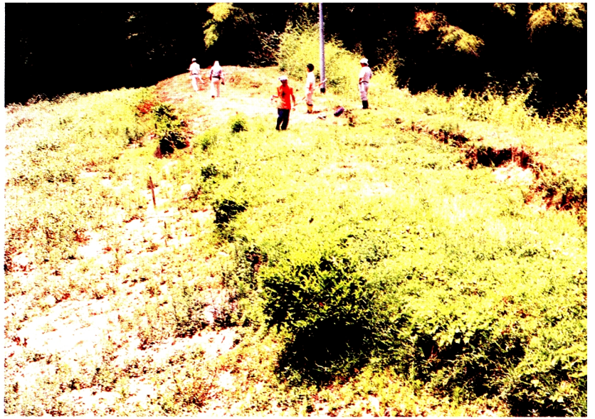
12. 榎池の滑り(淡路島)