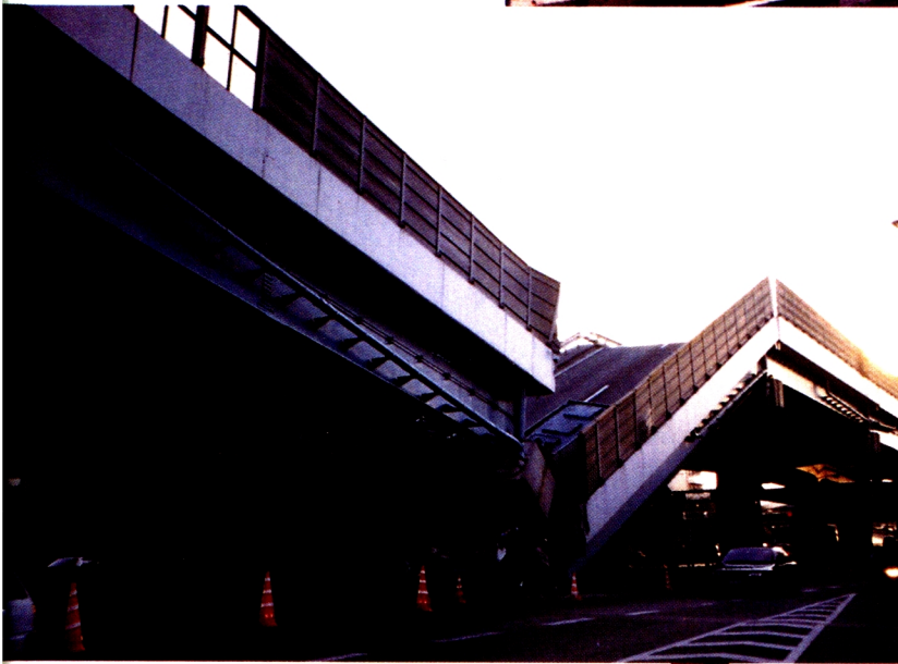
2. 高架橋倒壊・国道43号(西宮市)