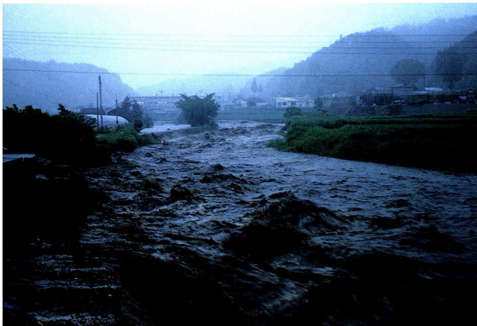
台風19号による河川の氾濫(大分県庄内町の大分川支流)

平成29年の台風19, 20, 21号は、瀬戸内、九州および関東地方を中心とした地域に甚大な被害を与えた。これらの報告は、「小特集・台風災害から学ぶ」に詳しいので、フォト・レポートとともに熟読玩味され、今後、同種の災害を未然に防止する方策を考察する際の一助となれば、と編集いたしました。