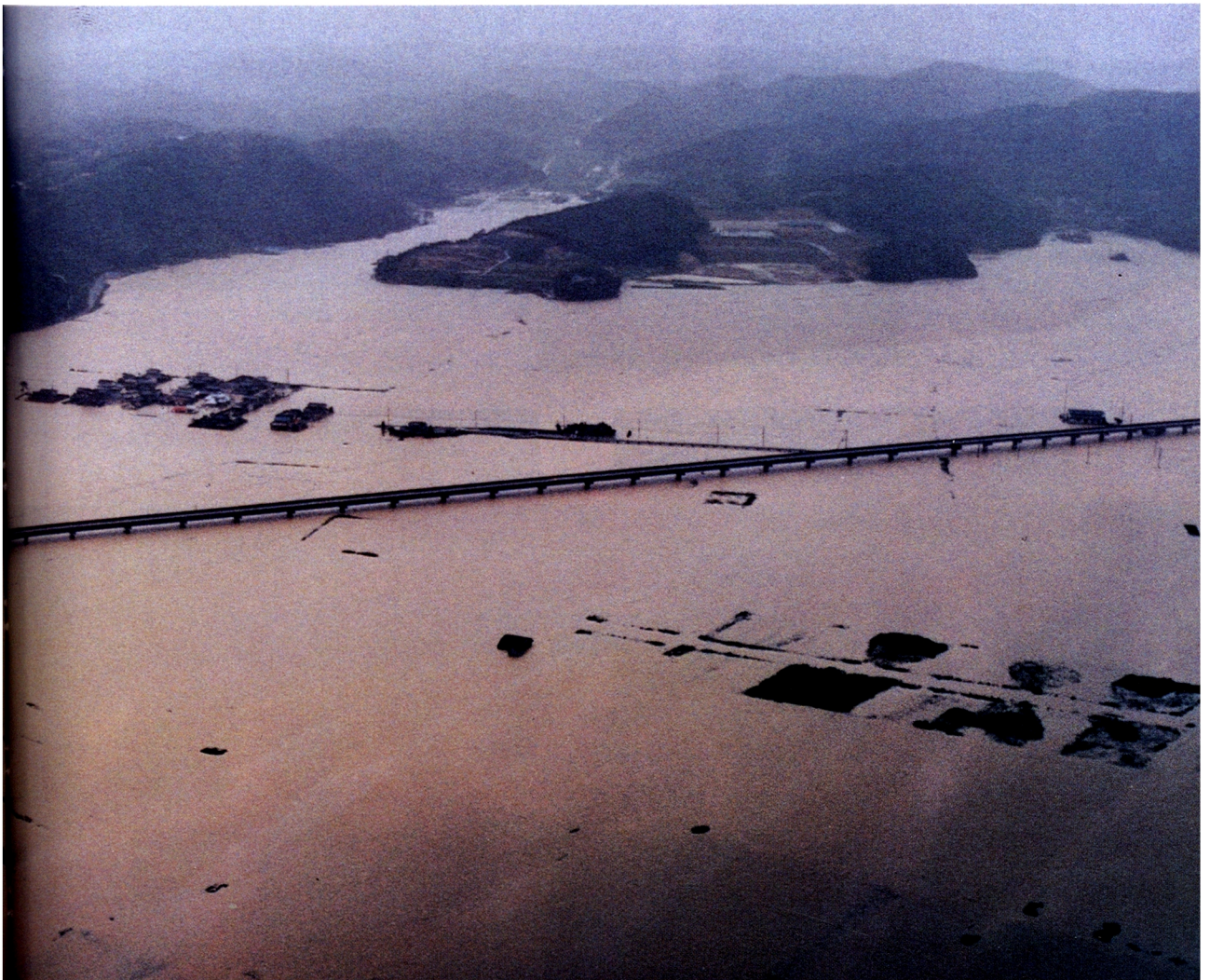
台風19号による水田の湛水(岡山県邑久町)