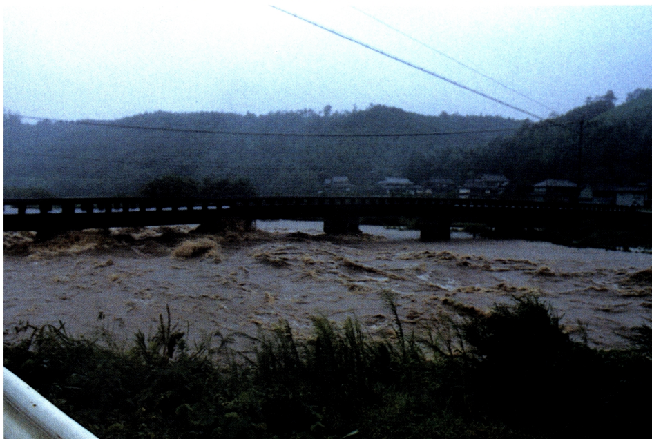
台風19号による大分県竹田市の玉木川の氾濫