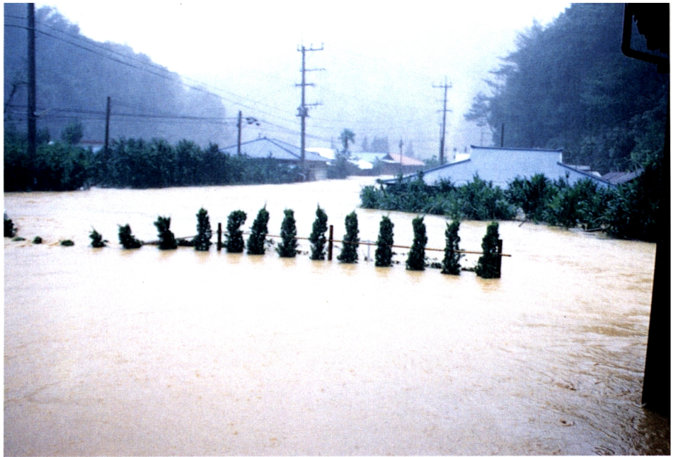
台風19号による農地の湛水(鹿児島県大島郡住用村西仲間地区)