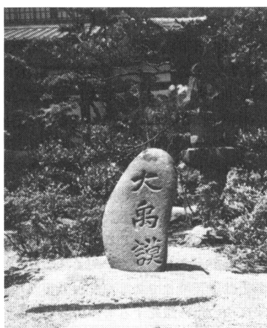
写真-1 栗林公園内の「大禹謨」の石碑

視するわけではないが、讃岐の地で大きな足跡を残した西嶋八兵衛は、治水面ではまさしく「讃岐の禹王」であり、利水面では「讃岐の溜池の父」でもある。