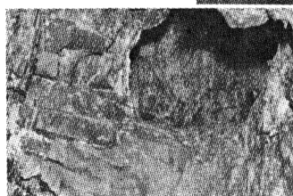
隧道内部の息抜き穴