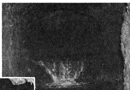
両口から掘りすすめた接合点 (どんどん)