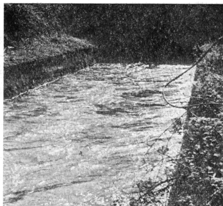
写真-2 国営造成による現寿安堰

月を経て元和6年にわが国信徒に伝えられたが、奥羽にはミラノ生れのジュアン・パプチスタ・ボルロ神父がもたらしたとされている。教書に対する奉答文、すなわち古文書であるが、内容は奥州各藩のキリシタンの隆盛、あるいはそれに対する迫害の状況、および神父の活動等を伝えているもので日付が元和7年8月14日となっているので、教書が寿庵の手に届くまで約4年を経過している。末記署名者は17名で、その筆頭者となっているのが後藤寿庵であることから、当時における寿庵のキリシタン信徒としての地位およびその活躍のさまが偲ばれるのである。