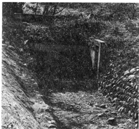
写真-1 旧寿安堰取入口