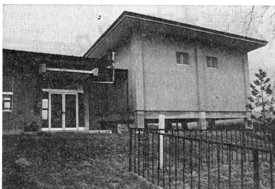
写真-1 古文書3万点をおさめる五郎兵衛新田記念館

ず三河田、常木の2用水の開削を行い、やがて、五郎兵衛新田用水の開発に着手した。この3セキ中、最も難工事であり、翁が心血を注いだ五郎兵衛用水の開発実態について、つぎに述べる。