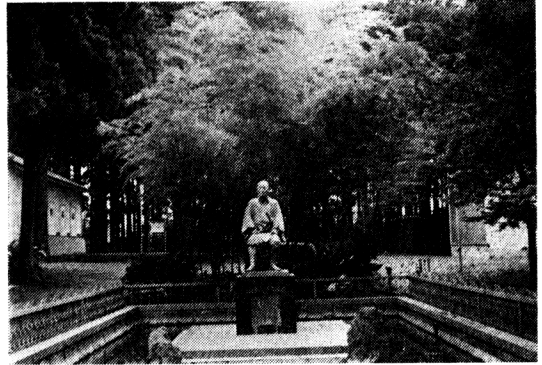
写真-4 太素塚記念館前の新渡戸傳翁の像

三本木地域は、南部駒の主産地であることから、三本木に駒市場を開設するなど街の発展に努めた結果、多くの人々も集まり開拓も軌道に乗ったので、民生安定のため、稲生神社、澄月寺、理念寺等を建立している。これらは都市計画に基づいての新駅経営で、その実現にはとくに十次郎の苦心が並々ならぬものであったといわれている。