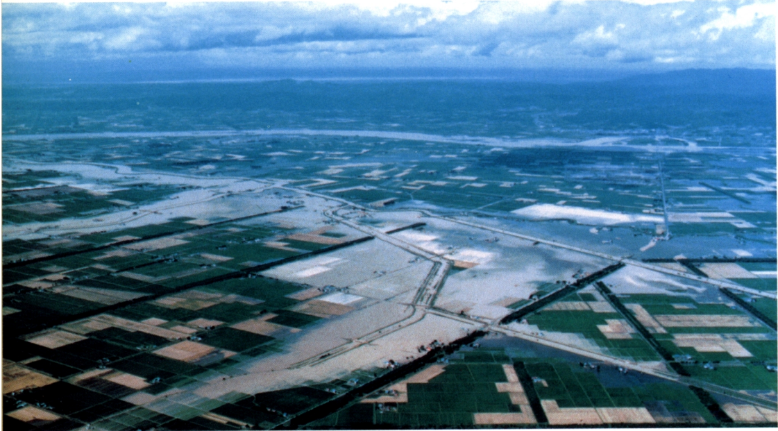
石狩川支流旧美唄川流域の被害状況（撮影：昭和56年8月5日午前10時、右下は略図）