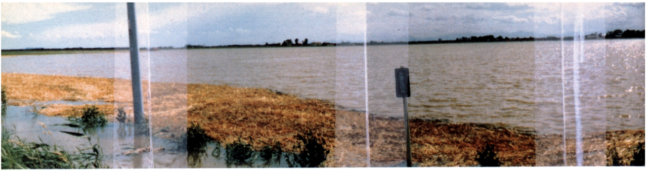
さんか びはいわ 産化美唄川流域の小麦収穫後の状況、麦稈の浮遊がよくわかる（撮影：昭和56年8月5日）