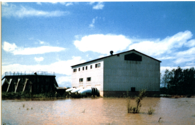
旧美唄川流域の三日月排水 機場の被害状況（撮影：昭 和56年8月6日）