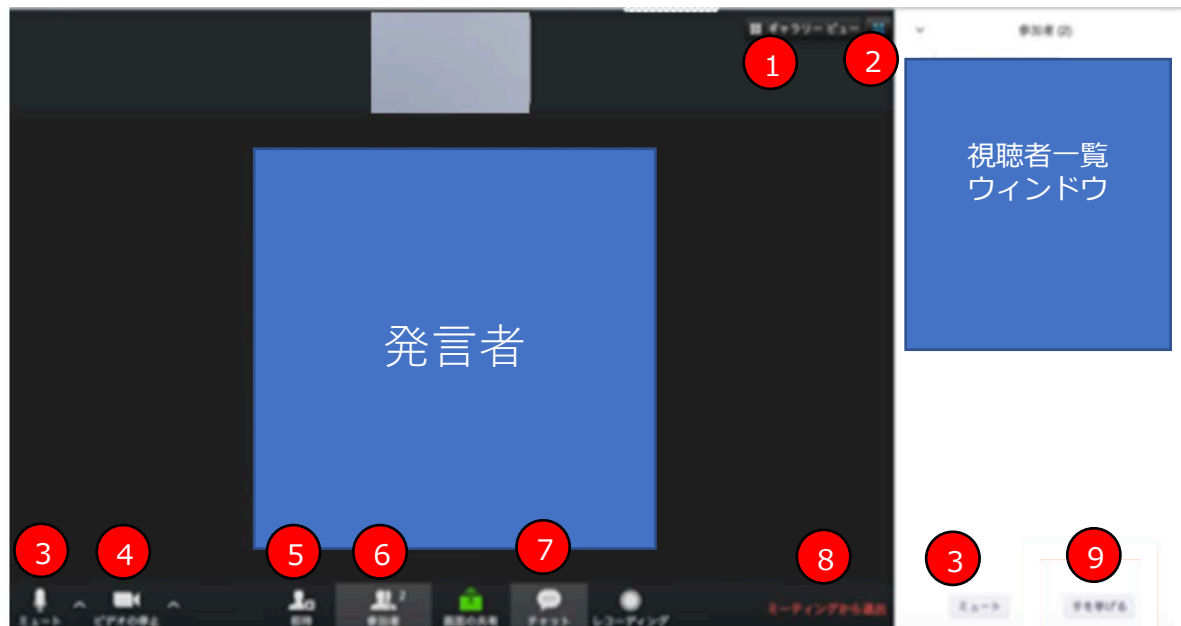
メイン画面 (スピーカービュー参考)